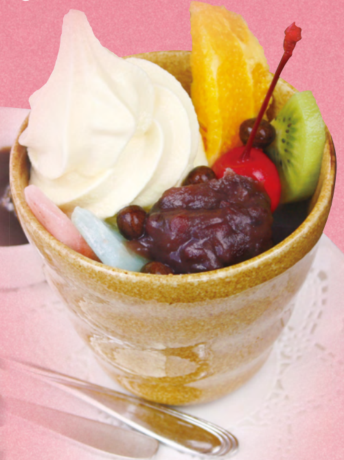
クリームあんみつ ¥750

抹茶アイス・小豆・白玉など、7つの味を 和テイストでまとめた豪華パフェです。 ※時季によりお休みさせていただきます。