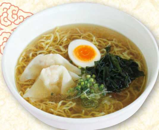
比内地鶏塩ラーメン ¥900