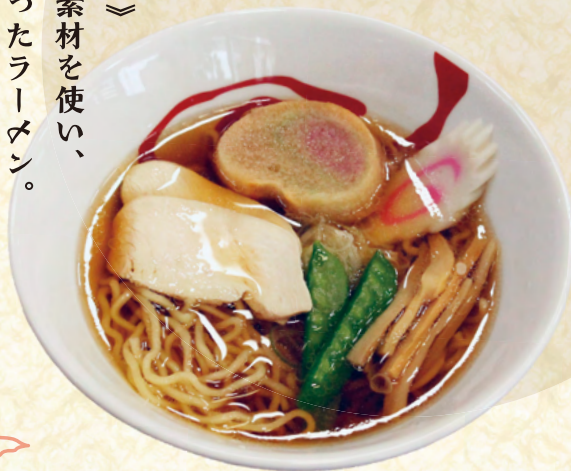
小町稲庭ラーメン ¥900