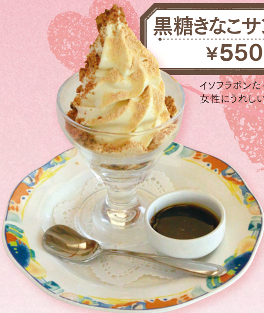
黒糖きなこサンデー ¥550