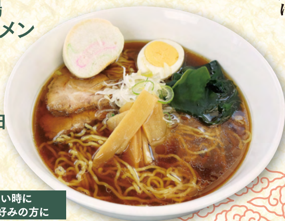
半分醤油 ラーメン ¥550