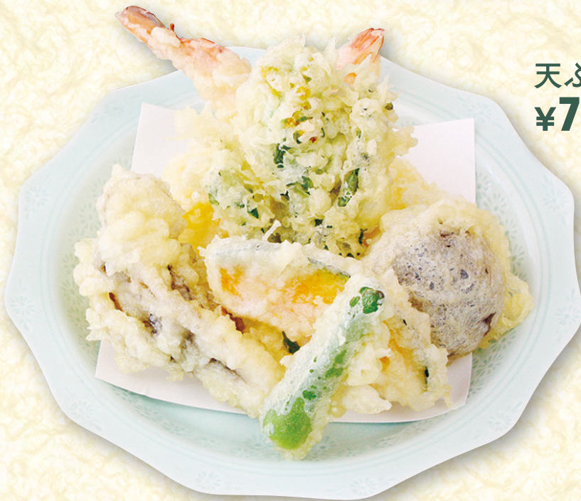
天ぷら盛り合わせ ¥750